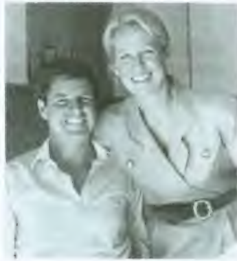
2 بريمر وزوجته الفرنسي